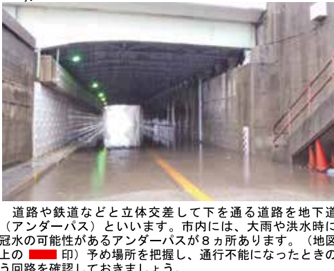
道路や鉄道などと立体交差して下を通る道路を地下道(アンダーパス)といいます。市内には、大雨や洪水時に冠水の可能性があるアンダーパスが8カ所あります。(地図上の印) 予め場所を把握し、通行不能になったときの迂回を確認しておきましょう。

福祉避難所とは、高齢者や障がいのある人など、一般の避難所生活において配慮を必要とする要配慮者が一時的に生活をする避難所です。また、一般の避難所とは異なり、必要に応じて開設する二次的な避難所です。