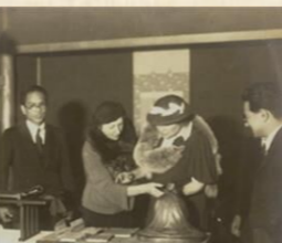
▲保己一の小さな像に親しげに触れているヘレン・ケラー