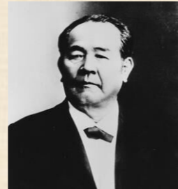
▲渋沢栄一